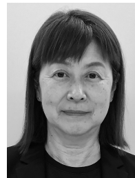
所有する当社株式の数 — 株