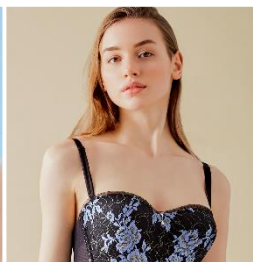
デコルテ リュミエス シリーズ