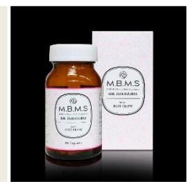
健康食品及びサプリメント