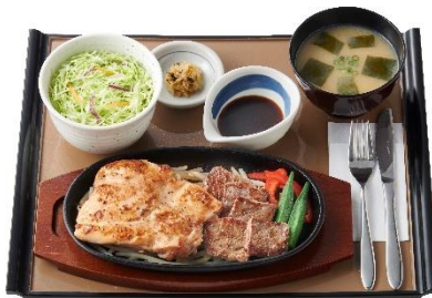
コンビ・筋肉定食