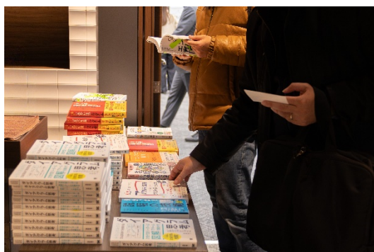
↑書籍プレゼント企画を実施

会場は会社や職種の垣根を越えて交流する参加者の熱気に包まれ、オフラインならではの「刺激し合う学び」が実現しました。