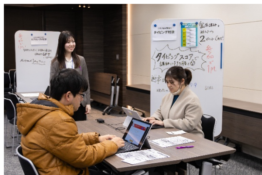
↑タイピング対決の様子