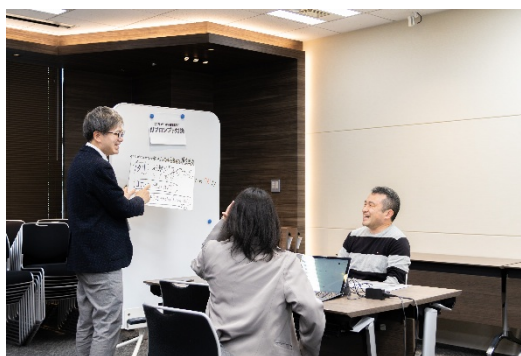
↑AI プロンプト対決の様子