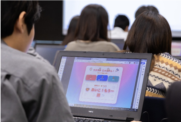
AI を使用して作成したじゃんけんゲーム

「業務にそのまま活かせる AI の使い方を体験できました。AI への取り組み方、利用方法についての座学も分かりやすかったです」