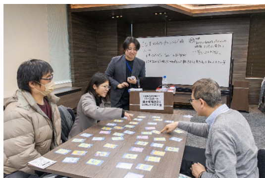
↑ICT かるたチャレンジの様子