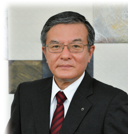
日本電信電話株式会社 代表取締役社長 社長執行役員

株主の皆さまにおかれましては、何卒より一層のご理解とご支援を賜りますようお願い申し上げます。