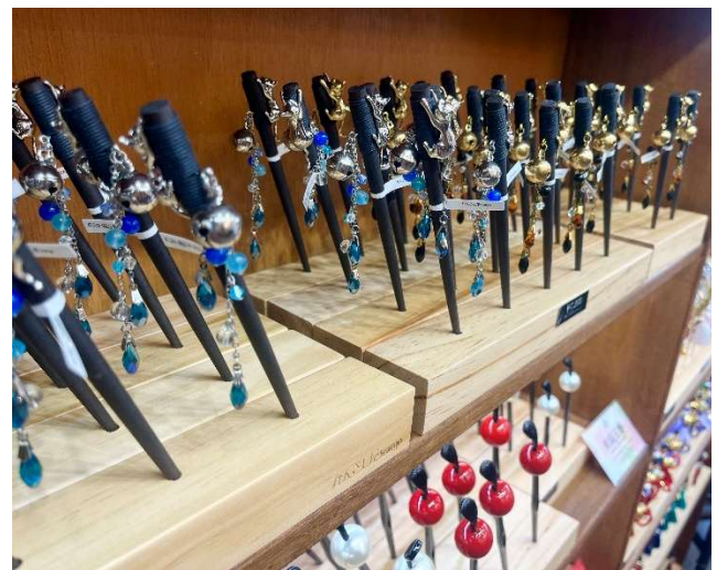
『かんざし屋 wargo』店内イメージ

『かんざし屋 wargo』は、モード、カジュアル、フェミニンなど、現代の多様なファッションテイストに調和するデザインの簪(かんざし)を豊富に取り揃えた専門店です。髪飾りを主役にした新しいヘアスタイリングを提案し、伝統的な和装にはもちろん、日常の洋装にも映えるトータルコーディネートをご提案いたします。