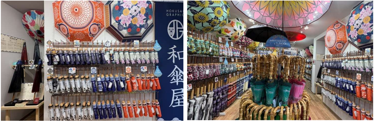
『北斎グラフィック』店内イメージ