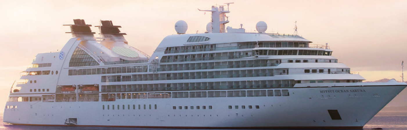
クルーズ船「MITSUI OCEAN SAKURA」(2026年9月就航予定) 画像はイメージです