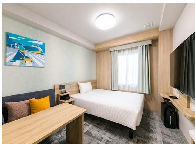
足を伸ばしてくつろげるソファセット付きのダブルルーム

「たびのホテル宇都宮ゆいの杜」は、自社ホテルブランド「サンフロンティアホテルズ」のカジュアルブランド「たびのホテル（TABINO HOTEL）」として栃木県に初出店いたします。