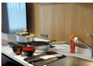
調理器具のお貸出し