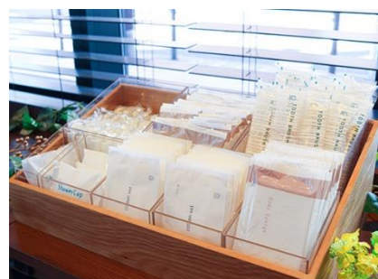
フリーアメニティコーナー