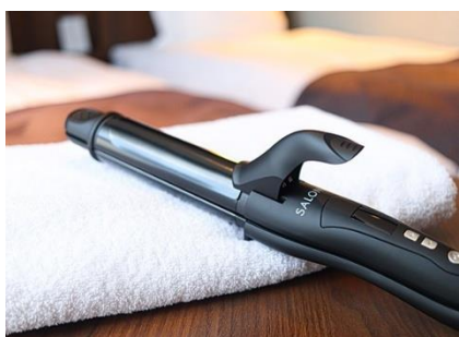
ヘアアイロンも全室常備

また、SDGs（持続可能な開発目標）の取り組みの一環として、プラスチック削減およびリサイクル促進を目的に、フロントに フリーアメニティコーナー を設置しています。綿棒、コットン、ボディタオル、ヘアブラシ、ヘアゴム、カミソリ、ティーバッグなどを取り揃え、必要な分だけお取りいただくことで、環境負荷の軽減に努めています。