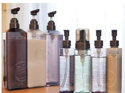
バスアイテムと基礎化粧品