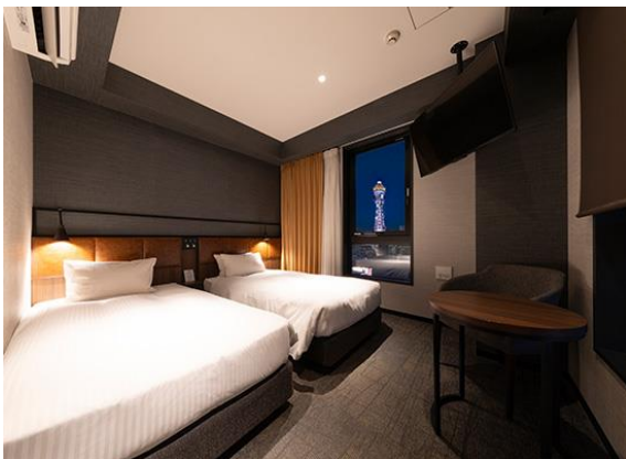
「デラックスツイン」

客室は、18㎡以上のツインルームが全体の6割以上を占め、観光後の疲れを心地よく癒す、落ち着いたあるモダンな空間です。全客室に、アメリカ発祥で世界3大ベッドメーカーの一つであるサータ社製の寝心地の良いベッド、テーブルとチェアを備えるほか、NetflixやYouTubeなどをお楽しみいただけるスマートテレビ、冷蔵庫、ケトルなどを完備し、快適にお過ごしいただけます。また、高さ300mの超高層複合ビル「あべのハルカス」や「通天閣」を望む客室もあり、新世界エリアならではの街の表情を客室からお楽しみいただけます。