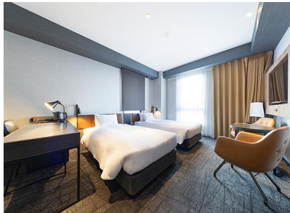
「スイートルーム」※ユニバーサルルーム利用可