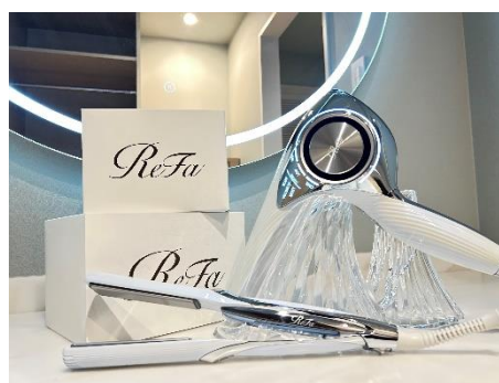
デラックスファミリールームは ReFa のドライヤーをご用意