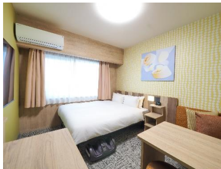
スタンダードダブル(18 m 2 )