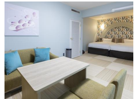
デラックスファミリールーム(40 m 2 )

客室は 10 階から 19 階に位置しており、大阪ベイエリアやシティエリアの美しい夜景をご覧いただけます。エレベーターホールには旅行気分を盛り上げる壁画を設置いたしました。大阪をモチーフにしたアートで全 6 種類ございます。ご旅行の思い出にフотスポットとしてもご利用ください。