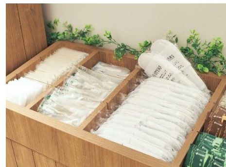
フリーアメニティコーナー