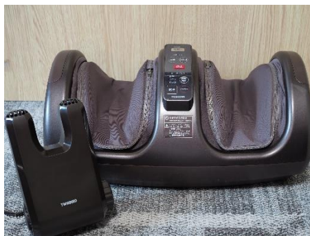
全室にフットマッサージャー、くつ乾燥機