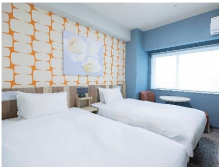
スタンダードツイン(18 m 2 )

明るくポップなデザインを基調としつつ、木のぬくもりを感じるインテリアを備え、ワクワクとリラックスを共存させる空間を演出しています。壁には大阪をモチーフとしたアートを飾り、その土地の空気を感じられる、温かみのある雰囲気のお客室に生まれ変わりました。寝心地の良いサータ社製の快眠ベッド、ゆったりくつろげるソファとテーブル、加湿空気清浄機のほか、 フットマッサージャー や くつ乾燥機 を設置しており、旅の疲れを癒し快適にお過ごしいただけます。また、靴を脱いでお寛ぎいただけるファミリールームや和モダンフォースなど、お部屋タイプも充実しています。さらには、 50インチ以上の大型スマートTV を導入し、お客様ご自身のアカウントで各種有料コンテンツもお楽しみいただけます。