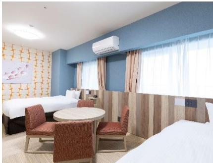
和モダンフォース(40 m 2 )