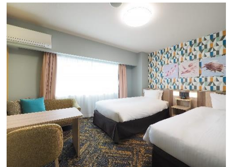
デラックスツイン(25 m 2 )