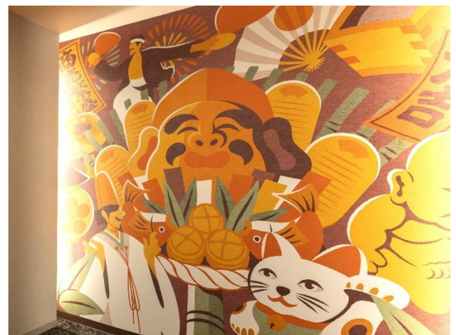
エレベーターホールの壁画