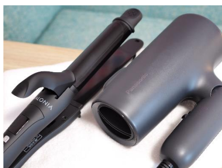
ヘアアイロンも全室常備

当ホテルでは、SDGs(持続可能な開発目標)の取り組みの一環として、プラスチック削減およびリサイクル促進を目的に、フロントに フリーアメニティコーナー を設置いたします。フリーアメニティコーナーには綿棒、コットン、ボディタオル、ヘアブラシ、ヘアゴム、カミソリ、ティーバッグをご用意しており、お客様には必要な分をお取りいただけます。この取り組みを通じて、使い捨てプラスチックの削減を進め、環境負荷の軽減に努めてまいります。