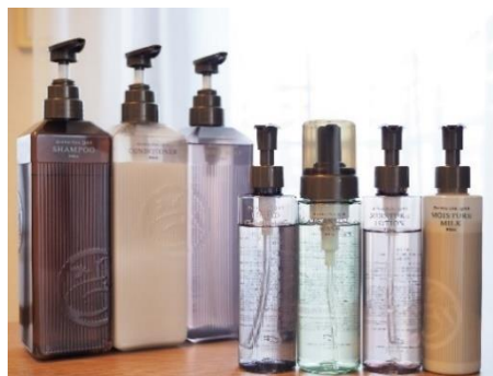
充実のアメニティ