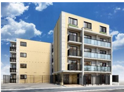
「EL FARO(エルファーロ)」シリーズ

当社が提供する新築 1 棟投資用賃貸マンション「EL FARO（エルファーロ）」、「LOS ARCOS（ロスアルコス）」、新築 1 棟投資用賃貸アパート「MIJAS（ミハス）」は資産価値の下がりにくい城南・城西地区を中心に展開しております。売却価格は「MIJAS（ミハス）」は 1 億円～10 億円前後、「EL FARO（エルファーロ）」は 5 億円～15 億円前後、「LOS ARCOS（ロスアルコス）」は 10 億円以上。全シリーズで平均稼働率約 97%（2026 年 2 月末時点）、優れた立地条件と魅力的なデザイン、上質な設備・仕様で高稼働・長期間稼働を実現すると共に、資産防衛、相続税対策に有効な安定的投資用商品としてお客様にご支持をいただいております。