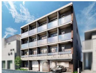
「LOS ARCOS (ロスアルコス)」シリーズ