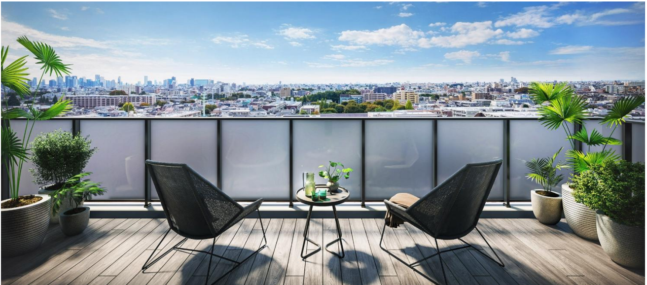
バルコニー完成予想図 Cタイプ (※13)