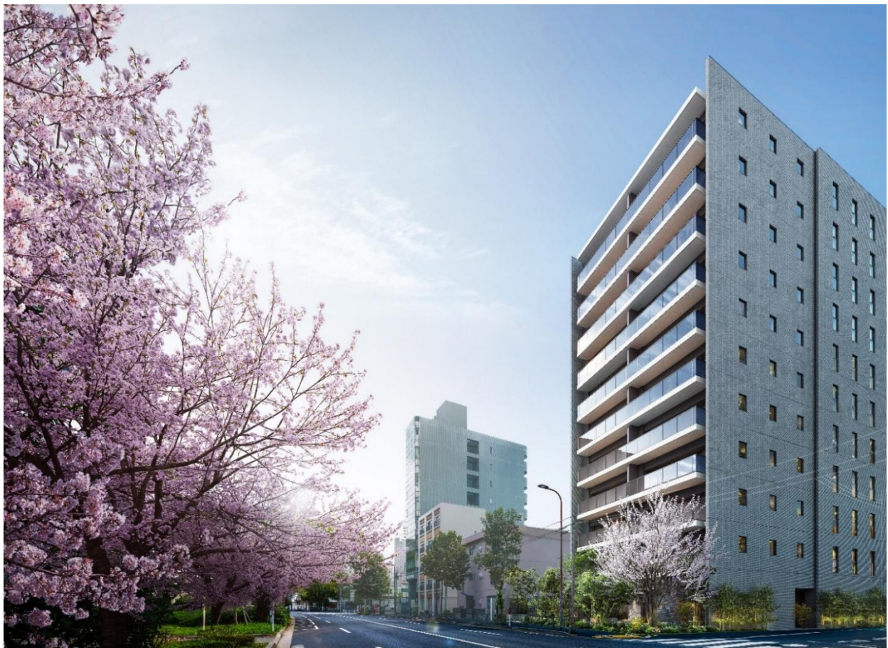
借景外観完成予想図（※2）

住戸は二面接道の開放的な敷地に総戸数41戸、2LDK～3LDK、46.14㎡～70.31㎡の全戸角住戸プランに加え、7.4m以上の間口を確保したワイドスパン設計（※1）やアウトフレーム設計を採用することで、デッドスペースを少なくした設計を実現し、快適性や機能性を向上させた住空間をご提案しています。