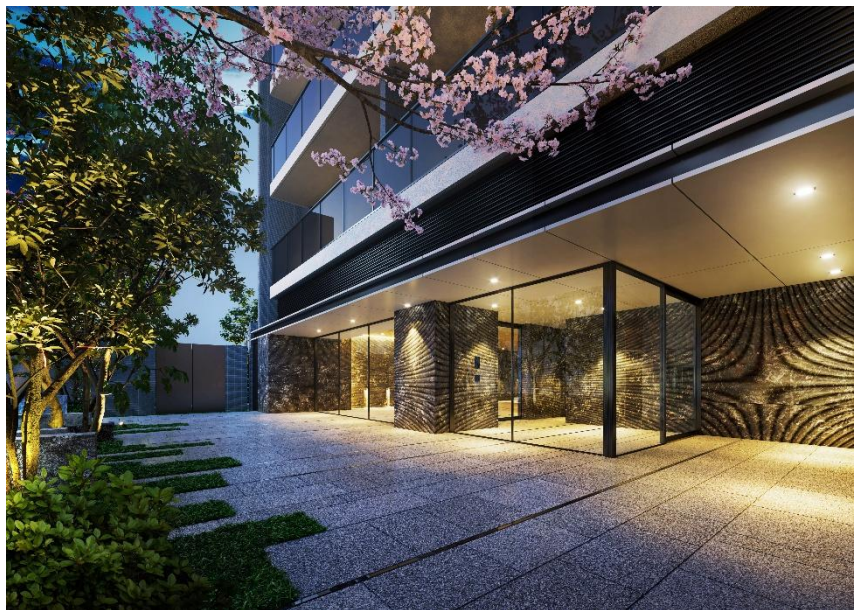
エントランスアプローチ完成予想図(※12)