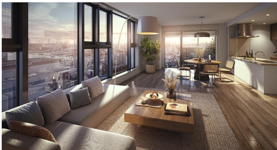
リビング・ダイニング・キッチン完成予想図 Hタイプ／有償設計変更プラン図（※10）

間取りは50㎡台（2LDK）から90㎡台（3LDK）まで11タイプのバリエーションをご用意し、多様なライフスタイルにお応えします。リビング・ダイニングとバルコニーの連続性を高めるため、エアコン室外機の配置を工夫し、視界を遮らないよう配慮しました。また、全住戸にウォークインクローゼットと室内物干金物を標準装備し、快適で心地よい居住空間をご提案します。