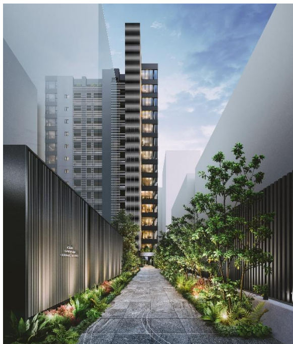
エントランスアプローチ完成予想図（※9）