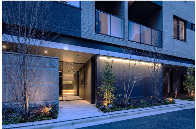
左：外観 右上：内廊下 右下：エントランス