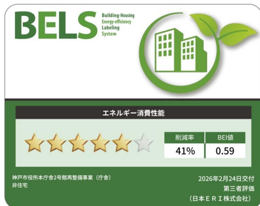
市庁舎部分：BELS 認証 ZEB-Oriented 相当

防災面では、中間階免震構造を採用することで地震時の安全性向上を図るとともに、浸水対策として電気室や機械室、防災センターなどの重要設備室を上層部に配置するなど、災害時のリスク低減を図ります。あわせて、民間エリアの一部を一時滞在施設として開放することを想定するなど、帰宅困難時対策の役割も担います。