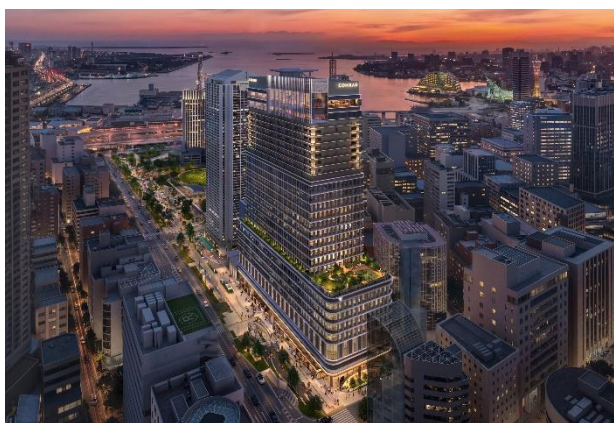
夜間時の外観（イメージ）

神戸の海と山を結び、周辺の景観と調和する神戸らしい上質な外観をイメージし、ホテルなどが入る高層部はガラスボックスを頂部に取り入れた特徴的なデザイン、市役所機能などが入る低層部は旧2号館から継承した水平基調を意図したデザインとしています。夜は天井の高いホテルロビー空間がライトアップされ、まちの灯台のように遠くからも港町神戸を感じられるランドマークとなります。