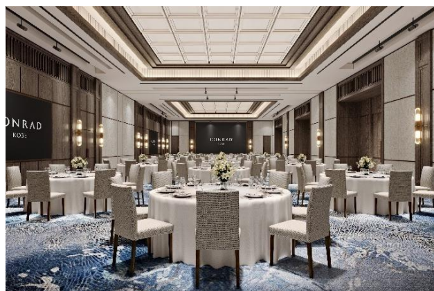
左：レセプションロビー、右：ボールルーム（イメージ）