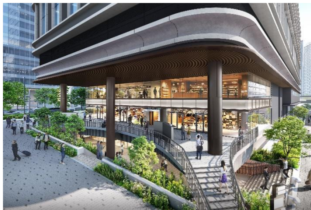
サンクンガーデンに面した商業施設（イメージ）

フラワーロード沿道に面した地上1・2階、さんちかや地下鉄海岸線三宮・花時計前駅とつながる地下1階を含む3フロアに、地域の魅力を発信するなど個性あるさまざまな飲食・物販・サービス店舗を配置するとともに、地上と地下をつなげる開放的なサンクンガーデンを整備することで、神戸のまちの回遊促進および賑わい創出を図ります。