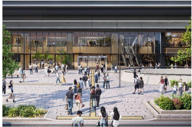
左：(仮称) 市民利用空間、右：正面エントランス前空間（イメージ）