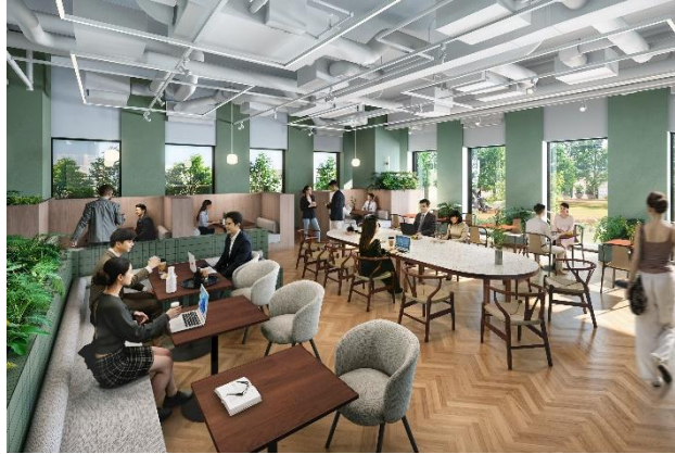
9階オフィスワーカー専用ラウンジ（イメージ）

神戸市内で最大級の1フロアあたりの貸付面積が約500坪（約1,680㎡）となるハイグレードなオフィスを整備します。1フロアの一体利用から最小約45坪（約150㎡）の分割利用まで、企業の進出ニーズに応じてフレキシブルにご利用いただけます。また、9階の屋上庭園に面して、気分転換やサードプレイスなどさまざまなシーンで利用できるオフィスワーカー専用ラウンジを整備し、オフィスワーカーのサポートと企業間交流の促進を図ります。