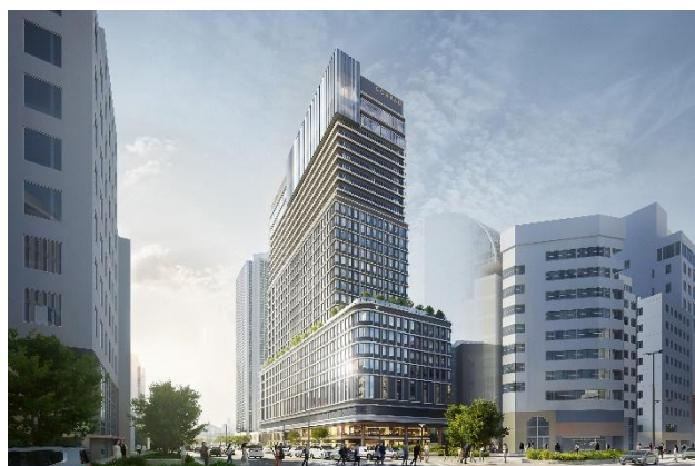
外観イメージパース※2

オリックス不動産株式会社（本社：東京都港区、社長：北村 達也）を代表企業として、阪急阪神不動産株式会社、関電不動産開発株式会社、大和ハウス工業株式会社、芙蓉総合リース株式会社、株式会社竹中工務店、安田不動産株式会社から構成されるコンソーシアム（以下、「本コンソーシアム」）は、このたび、「神戸市役所本庁舎2号館再整備事業」※1において、建設工事に本格着手しますのでお知らせします。