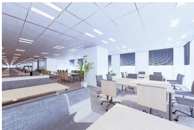
オープンな執務空間（イメージ）

コミュニケーションの活性化や時代の変化への柔軟な対応のため、間仕切りのないオープンな執務空間を確保するとともに、遮音性の高い会議室や上下階の交流を円滑にする内部階段の設置などにより、職員が働きやすく、生産性の高いオフィス環境を整備します。また、環境性能として、市庁舎部分において「ZEB Oriented」相当を達成し、BELS 認証（建物の省エネルギー性能を表示する第三者認証制度）を取得しています。