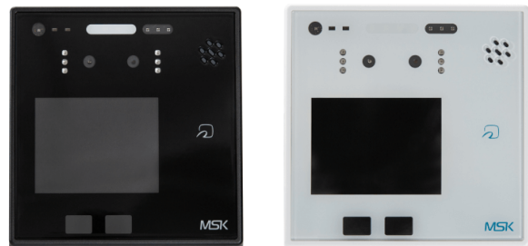
宮川製作所 純国産の顔認証端末

・防塵・防水等級 IP55 の株式会社宮川製作所製の認証端末を採用することで屋外利用に対応（オプションの専用ブラケットを利用）。