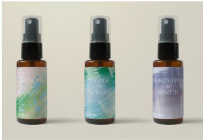
③アロマミストセット