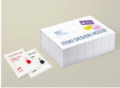
②ドリップコーヒーボックスセット