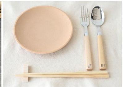
⑤アップサイクル テーブルウェアセット