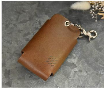
④アップサイクル 近江牛レザーキーケース