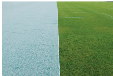
(左側が敷設後のシート。右側は未敷設の天然芝)

冬季の天然芝の養生のため、通気性、光透過性を確保しつつ、十分な保温性を持つ「天然芝養生シート」を開発し、この度、プロサッカーチームの練習場に採用されました。春には緑色の映える天然芝をご覧ください。