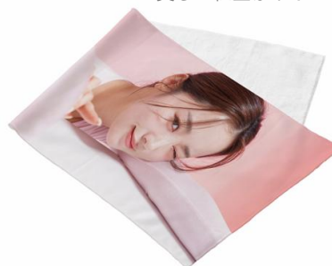
[ピクチャースタイルタオル]