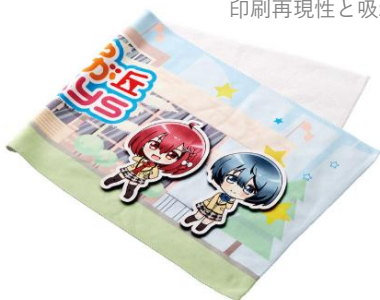
[コットンW フェイスタオル]