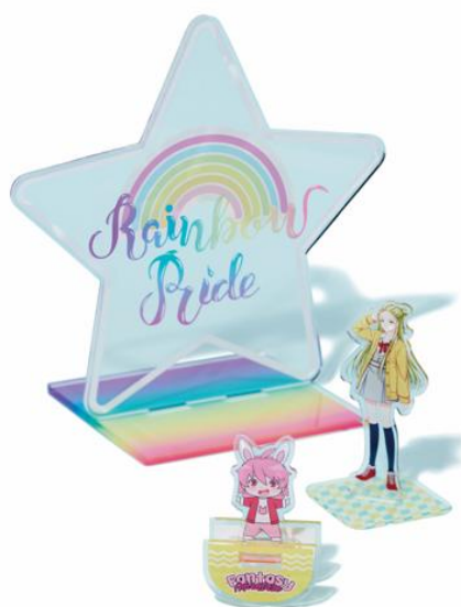
[アクリルスタンド]