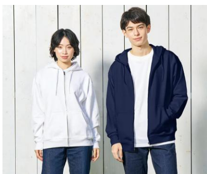
フルジップパーカー