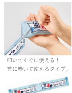
瞬間冷却パック ネックタイプ