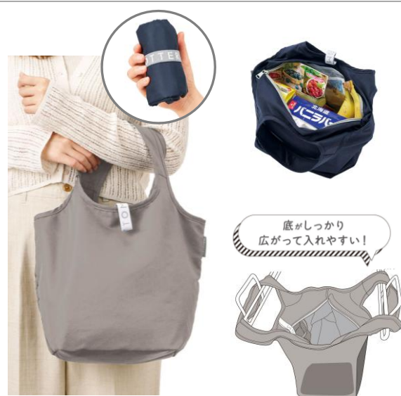
セルフレジで使いやすい コンパクトクーラーミニマルシェバッグ