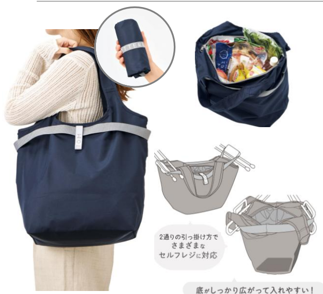
セルフレジで使いやすい コンパクトクーラーマルシェバッグ