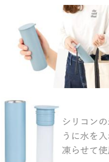
ポータブルシリコン氷のう