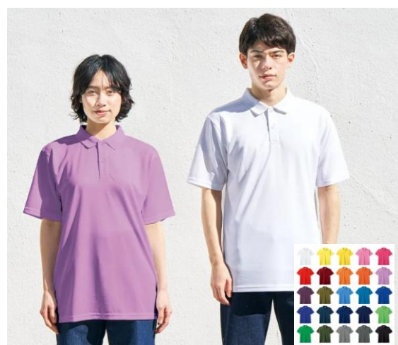
ドライポロシャツ