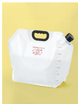
目盛り付ウォータージャグ 8L