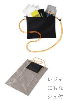
レジャーシートにもなるサコッシュ付き