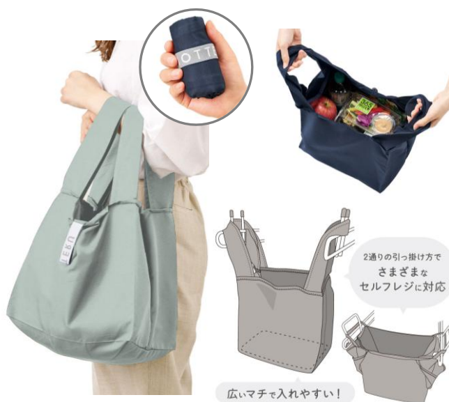
セルフレジで使いやすい スクエアデリバッグ