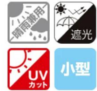
のびるハンドル5段遮光折りたたみ傘