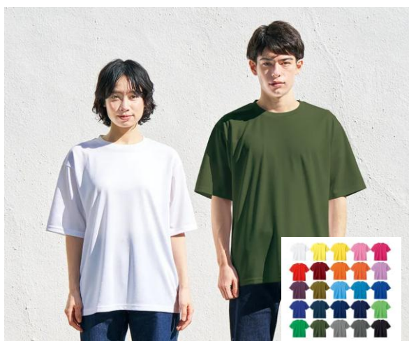
ドライ T シャツ