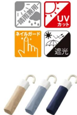
ドーム型ツートーン遮光折りたたみ傘