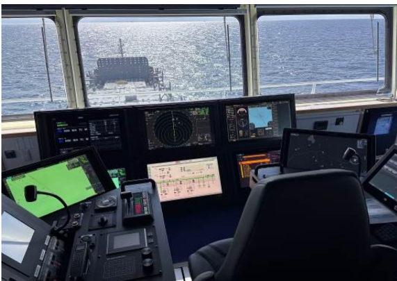
「げんぶ」統合ブリッジ

日本の内航業界における労働力不足解消や労務負担軽減、海難事故防止、離島航路維持等の社会的課題を解決し、安定的な国内物流・輸送インフラを支えるため、日本財団・DFFAS+参加各社・国内外の協力組織と共に、引き続きMEGURI2040に取り組んでまいります。