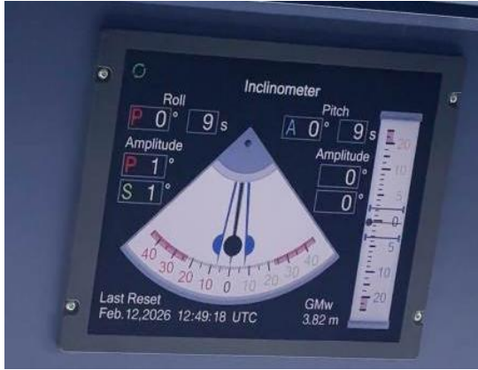
電子傾斜計 (TI-100シリーズ)