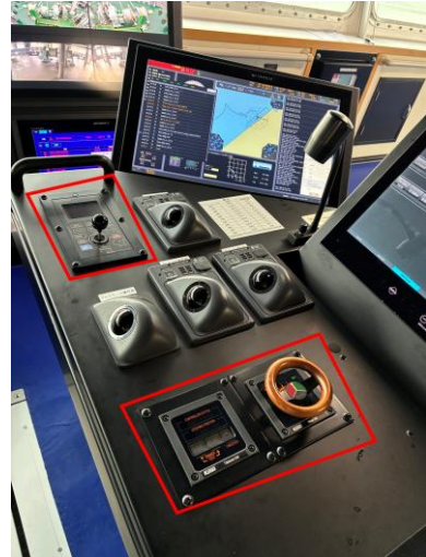
ジョイスティックコントローラーMJS-9000(左上) と テイクオーバーユニット (下)