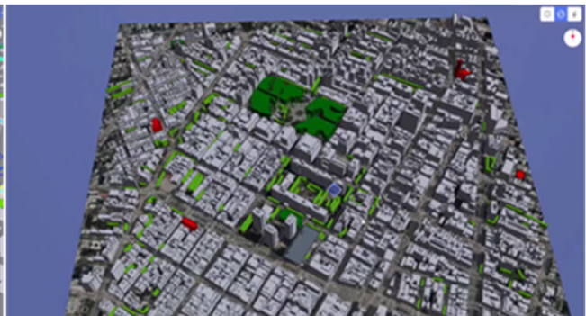
3D デジタルツイン画像