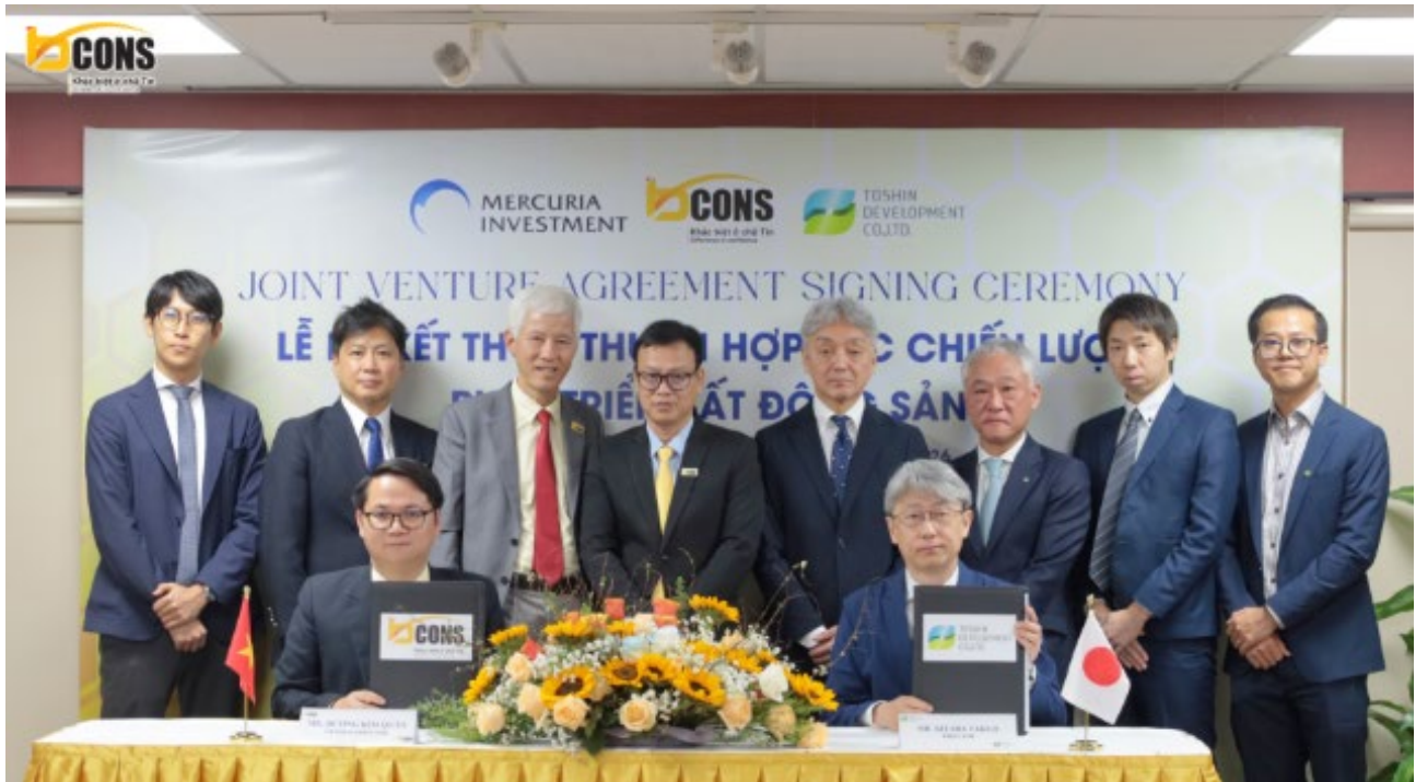
【Bcons 社、東神開発およびタイ法人との共同事業契約締結式】

株式会社マーキュリアホールディングス（以下、「当社」）は、グループ会社である Mercuria (Thailand) Co., Ltd.（以下、「タイ法人」）が、株式会社高島屋の連結子会社である東神開発株式会社（以下、「東神開発」）およびベトナムの不動産デベロッパーである Bcons Construction Investment Joint Stock Company（以下、「Bcons 社」）と共同事業契約を締結し、ベトナム・ホーチミン市の都市鉄道 1 号線延伸エリアに位置する 2 つの分譲住宅開発プロジェクト（以下、「本プロジェクト」）に取り組むこととなりましたので、お知らせいたします。