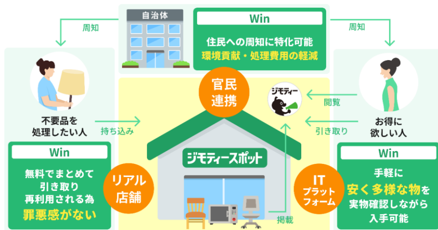
ジモスポの取り扱い品

ジモテースポットは、「まだ使えるけれど不要になったモノ」を地域内で譲り合うことができるサービスです。不要品を譲りたい方は予約なしで持ち込むだけで、次の必要とする人へつなぐことができます。譲り受けたい方は、地域の情報サイト「ジモティー」で商品情報を確認し、店舗で実物を見て購入・引き取りが可能です。リサイクルショップでは買取されないモノ、配送コストがかさむ家具まで、再販価値が低く捨てられがちな「まだ使えるモノ」を幅広くリユースしています。