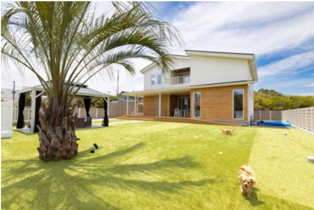
約 270 ㎡の庭やドッグランを備えた宿泊体感施設「RYOAN Ichinomiya」