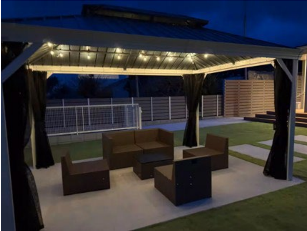
雨の日でも利用できるガゼボ。家族や仲間とのBBQも楽しめます。

本施設における販売・運営に関する全業務はオシエテが担当。快適で安心してご利用いただける運営体制を構築し、建築や地域の魅力を国内だけでなく、オシエテの強みであるグローバル対応で海外への発信も行うとともに、施設価値の向上を支援してまいります。