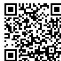
『いせれべ』 アプリ紹介サイトQRコード

https://iseleve1p.fun2play.net/web/index.php?id=1