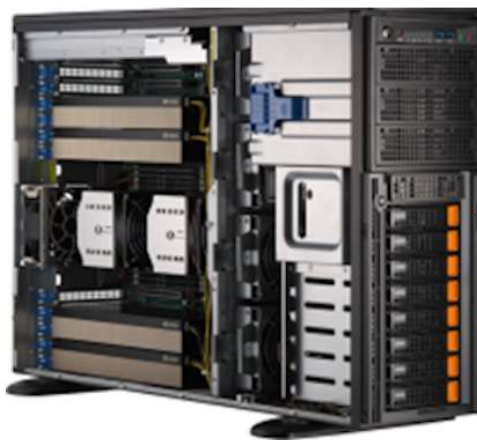
Cloudy DP (GPU サーバ)