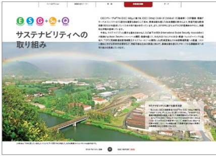
サステナビリティへの取り組み