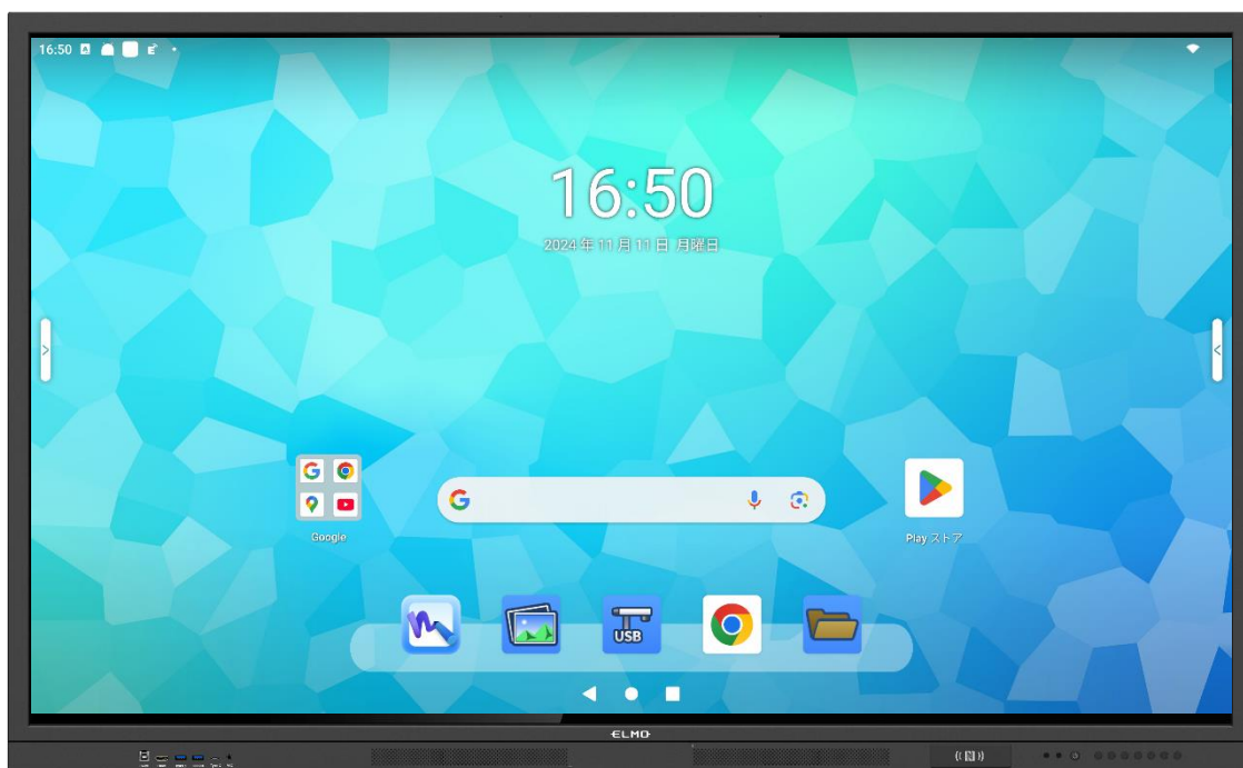
Google EDLA 認証モデル

本製品は教育現場やビジネスシーンでの DX を支援するツールとして、操作性と多機能性を充実させたモデルです。