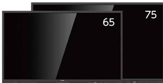
65 型・75 型の 2 モデルをラインナップ