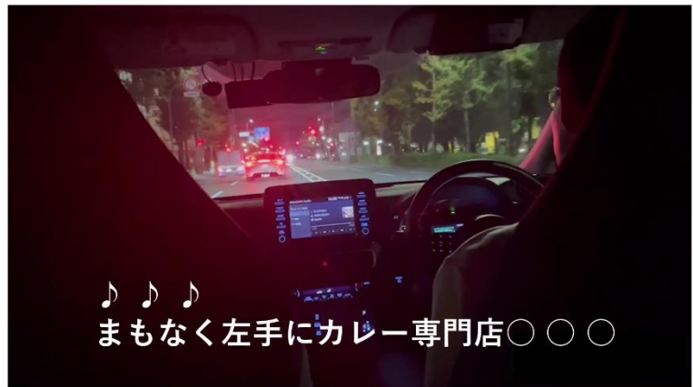
実証実験で京都の学生が市内をドライブし、タイミング判断システムを体験している様子