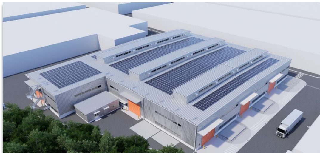
当社藤岡工場 新工場（第 12 工場）イメージパース