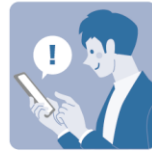
One Time 日時を アプリで受け取り