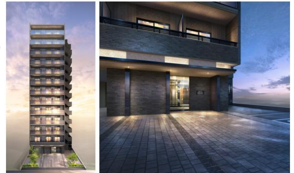
▲ 鍵が一切いらない”オール顔認証マンション” クレイシア IDZ 川崎ザ・レジデンス

物件名称 : クレイシア IDZ 川崎ザ・レジデンス 所在地 : 神奈川県川崎市川崎区本町一丁目 9 番 6 (地名地番) 交通 : 京急本線「京急川崎」駅徒歩 5 分 JR 東海道本線 他「川崎」駅徒歩 8 分 構造・規模 : 鉄筋コンクリート造 地上 13 階建て 総戸数 : 84 戸 (うち投資用 84 戸)