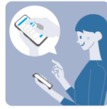
家族・知人の 来訪日時を登録