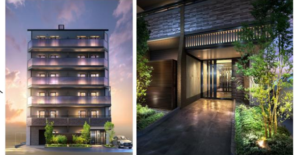
▲ 鍵が一切いらない”オール顔認証マンション” クレイシアIDZ二子新地

物件名称 : クレイシアIDZ二子新地 所在地 : 神奈川県川崎市高津区二子一丁目20番2 交通 : 東急田園都市線・大井町線「二子新地」駅徒歩5分 東急田園都市線・大井町線「高津」駅徒歩10分 東急田園都市線・大井町線「二子玉川」駅徒歩12分 構造・規模 : 鉄筋コンクリート造 地上7階建て 総戸数 : 24戸（うち投資用24戸）