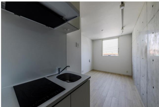
▲ FRC梅屋敷 内観