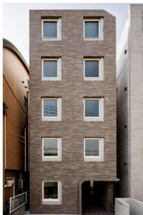
▲ FRC梅屋敷 外観

両手が塞がっていても出入りのできる利便性をご提供するとともに、最先端の顔認証技術で高いセキュリティを両立させ、多様化するお客様のニーズにお応えしてまいります。