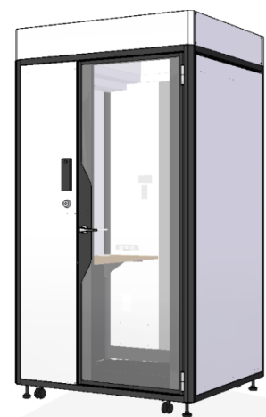
▲ PRIVATE BOX®