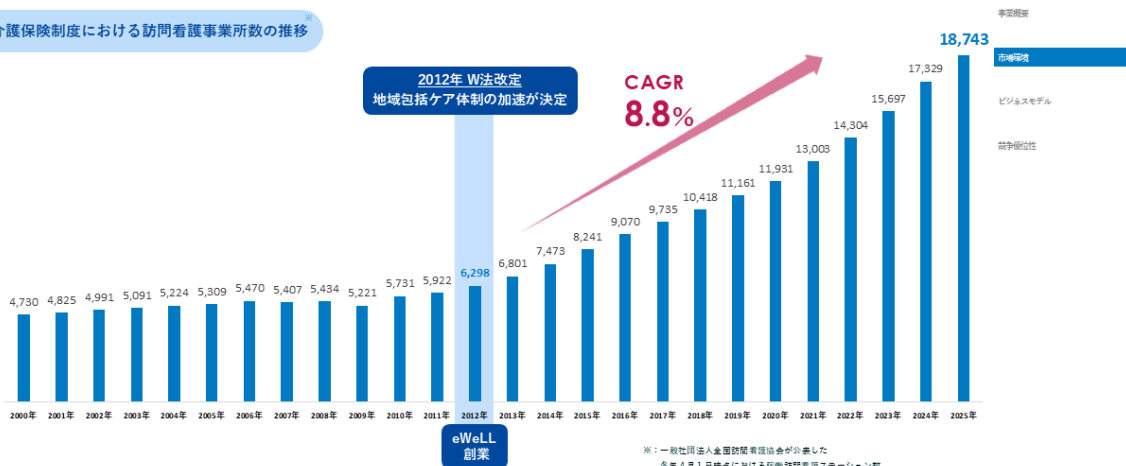
介護保険制度における訪問看護事業所数の推移

医療と介護の複合的なニーズの増加に対し、担い手不足の観点から在宅医療の受け皿は拡大 2025年4月現在18,743ステーションであり、 拡大傾向は今後も継続する想定