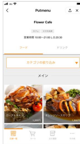
店舗のメニューが表示