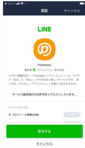
利用の許諾画面 (初回のみ)