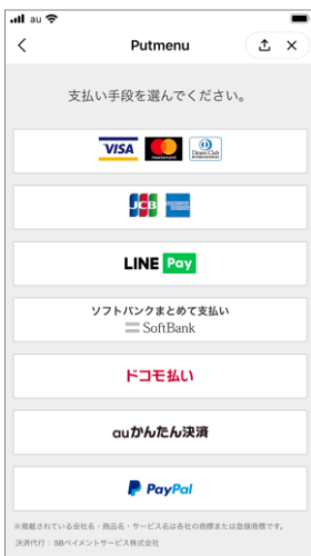
オンラインで決済