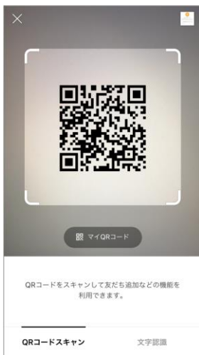
QRコードを読み込み