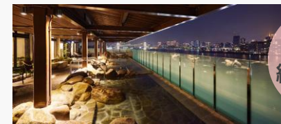
東京豊洲 万葉倶楽部