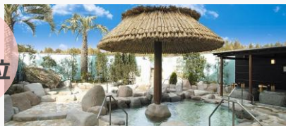
有馬温泉 太閤の湯