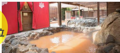
天然露天温泉スパミノエ