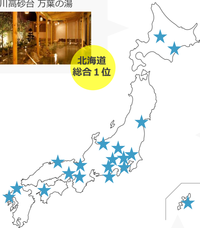
ユインチホテル南城 天然温泉さしきの 猿人の湯