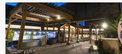
湘南RESORT SPA 竜泉寺の湯