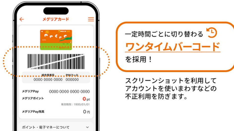
『メグリアカード』画面（イメージ）