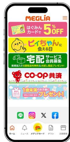
『MEGLiA』公式アプリのアイコンとトップ画面（イメージ）