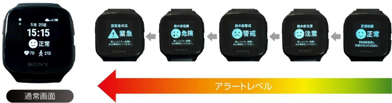
リストバンド 画面イメージ