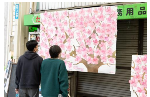
京都市の出町樹形商店街アーケードに貼られた、地域の方々の夢

Dream スポットの場所詳細は、April Dream 公式サイト「Dream マップ」に随時更新しています。お近くの Dream スポットへ足を運んで、春に満開の夢を眺める“夢見”を体験していただけたらと思います。