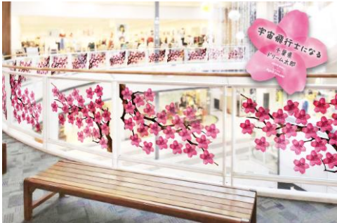
全国 138 のイオンモールが、夢咲く桜で満開に。

全国 138 の「イオンモール」をお客さまみんなの夢で桜を満開にしようという、全国規模ショッピングモールとの特別コラボレーションや、全国 332 店の「保険見直し本舗」でお客さまの夢の桜を咲かせようという取り組み、また全国 63 店の「赤ちゃん本舗」では来店される親子の夢で桜を満開にしようという取り組み、全国 130 の学習塾「ベスト個別」では生徒の夢で桜を満開にする取り組みなど、普段の生活圏内で参加しやすいスポットが全国規模で広がっているという進化を遂げています。