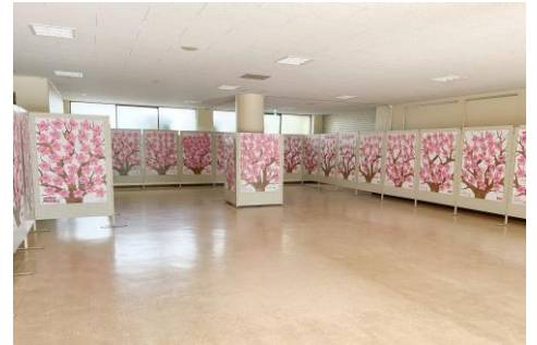
伊予市の市民の夢で満開の展示会場。

さらに、サッカーの「サンフレッチェ広島」やバレーボールの「サントリーサンパーズ大阪」など、プロスポーツチームも参加し、選手の夢とサポーターの夢が一体となって桜を満開にします。4月1日の入社式に活用する企業も増え、新入社員が夢を桜に書いて宣言したり、小中高校や大学・専門学校などで、生徒や学生が書いた夢を掲示したり、卒業式や入学式で桜に書かれた夢を飾ることも広がっています。飛騨市、佐世保市、南相馬市、伊予市や浪江町など自治体が、市民が夢を桜に書いて見られる場を用意する動きも、他地域でも広がりつつあります。また、患者さんとその家族の夢が集まる病院、子どもたちの夢が咲く地域の駄菓子屋さん、町のレストランやパン屋さん、ホテルやお寺に至るまで、様々な場所で人々の夢の桜が咲いています。