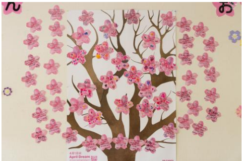
飛騨市の保育園で園児と先生たちが書いた夢。

さらに、サッカーの「サンフレッチェ広島」やバレーボールの「サントリーサンパーズ大阪」など、プロスポーツチームも参加し、選手の夢とサポーターの夢が一体となって桜を満開にします。4月1日の入社式に活用する企業も増え、新入社員が夢を桜に書いて宣言したり、小中高校や大学・専門学校などで、生徒や学生が書いた夢を掲示したり、卒業式や入学式で桜に書かれた夢を飾ることも広がっています。飛騨市、佐世保市、南相馬市、伊予市や浪江町など自治体が、市民が夢を桜に書いて見られる場を用意する動きも、他地域でも広がりつつあります。また、患者さんとその家族の夢が集まる病院、子どもたちの夢が咲く地域の駄菓子屋さん、町のレストランやパン屋さん、ホテルやお寺に至るまで、様々な場所で人々の夢の桜が咲いています。