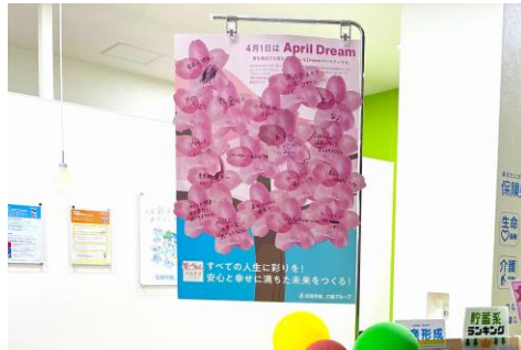
保険見直し本舗は 332 店で夢を咲かせる。