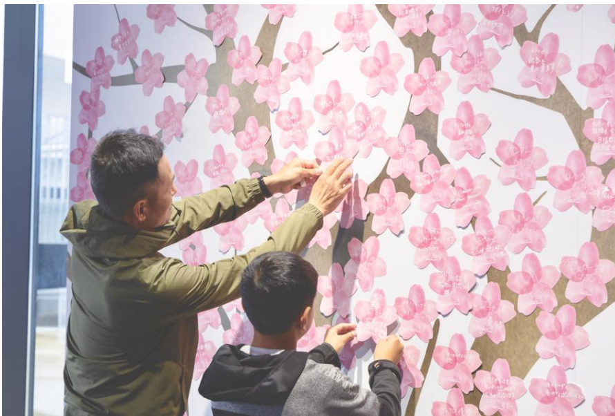
エディオンビスケットウイング広島（サンフレッチェ広島）のミュージアム内の April Dream ボードにサッカーの夢を貼る親子

山手線 Dream トレインが全国の夢を乗せて本日より 2 週間運行。 桐生祥秀選手、富永愛さんら共感いただいた著名人 11 名の“夢”桜が、本日より山手線と羽田に初登場！