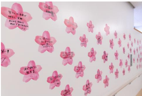
筑波メディカルセンターで患者や家族、職員らが書いた夢。