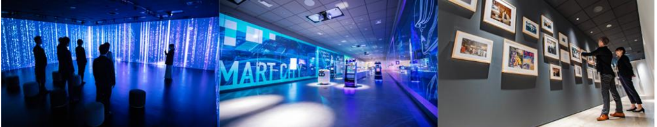
ソフトバンク株式会社の「Executive Briefing Center」