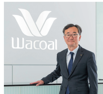
株式会社ワコールホールディングス 代表取締役 社長執行役員