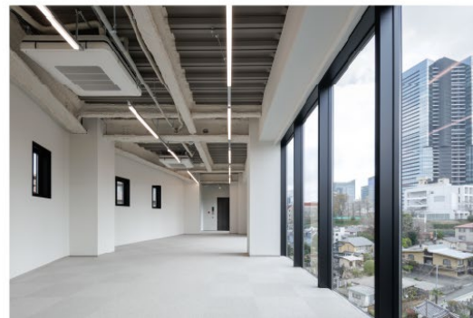
【『GranDuo 白金高輪』外観・内観】

本物件は、都営三田線、東京メトロ南北線「白金高輪」駅から徒歩6分のすぐれた交通利便性を有しています。また、本エリアでは高輪ゲートウェイシティをはじめ開発が進行中であり、街の魅力は一層高まる見込みで、将来的な都市機能の向上や地域価値の上昇が期待されています。このように、立地、環境、将来性のすべてが揃うエリアだからこそ、本物件は事業者の皆さまに上質さと快適さを備えた新たな拠点を提供することを目指し、計画いたしました。