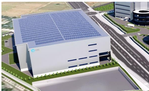
35 ログスクエアふじみ野 C 2027 年竣工予定