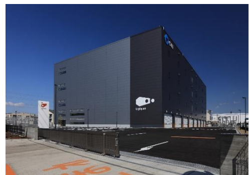
24 ロジスクエア厚木 I 2023年3月竣工