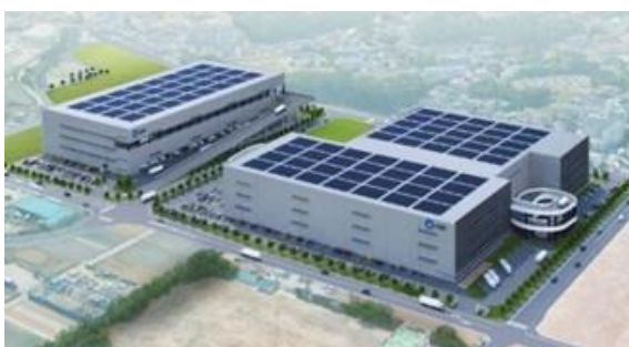
38 ログスクエア朝霞 A 2027 年竣工予定 39 ログスクエア朝霞 B 2027 年竣工予定