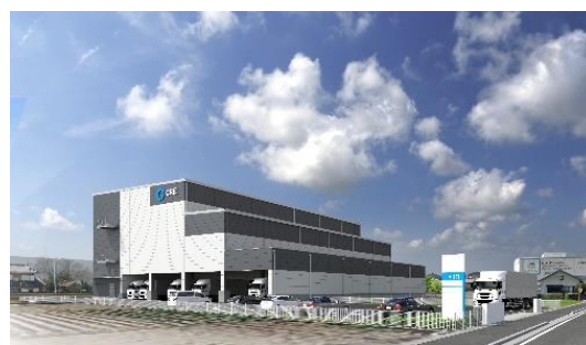
40 ログスクエア久喜Ⅲ 竣工時期未定