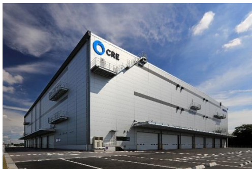
13 ロジスクエア春日部 2018年6月竣工