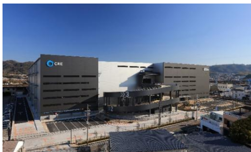
19 ロジスクエア大阪交野 2021年1月竣工