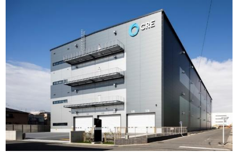
34 ログスクエア草加Ⅱ 2024年10月竣工