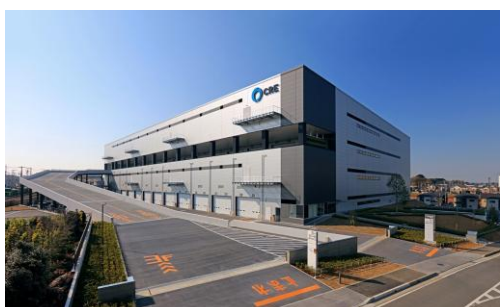
7 ロジスクエア浦和美園 2017年4月竣工