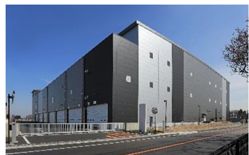
20 ロジスクエア三芳 II 2021年3月竣工