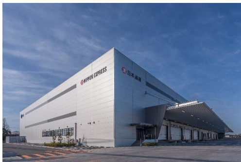
11 ロジスクエア鳥栖 2018年2月竣工