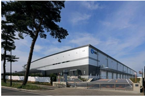
9 ロジスクエア守谷 2017年5月竣工