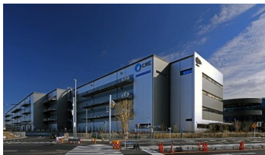
27 ロジスクエアふじみ野 A 2024年1月竣工