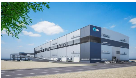
41 ログスクエア名古屋みなと 2025 年 12 月竣工予定