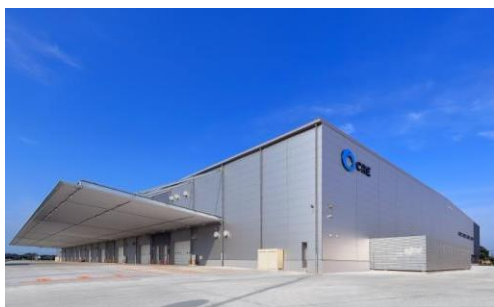
5 ロジスクエア羽生 2016年7月竣工