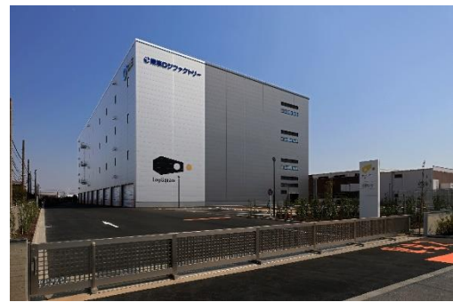
30 ロジスクエア厚木Ⅱ 2024年3月竣工