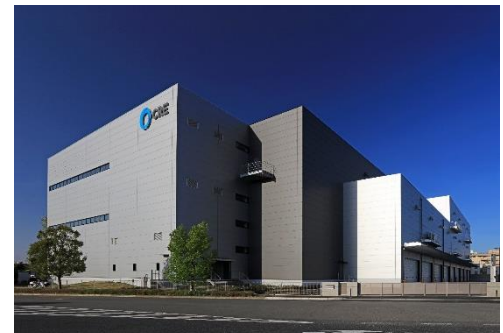
14 ロジスクエア上尾 2019年4月竣工