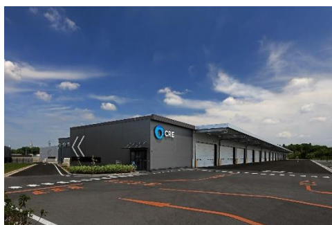
31 ロジスクエア成田 2024年5月竣工