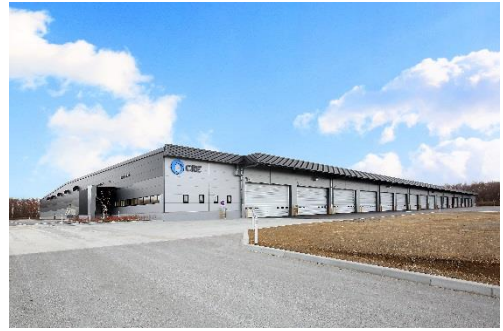
10 ロジスクエア千歳 2017年12月竣工