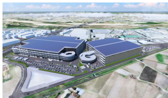
36 ログスクエア京田辺 A 2025 年 2 月竣工予定 37 ログスクエア京田辺 B 2026 年 8 月竣工予定