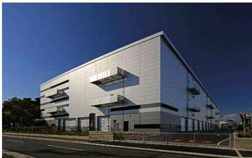
21 ロジスクエア伊丹 2022年11月竣工