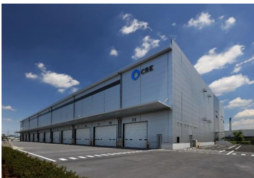
15 ロジスクエア川越Ⅱ 2019年6月竣工