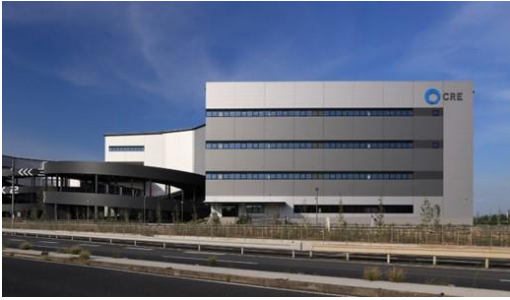
33 ログスクエアふじみ野 B 2024年10月竣工