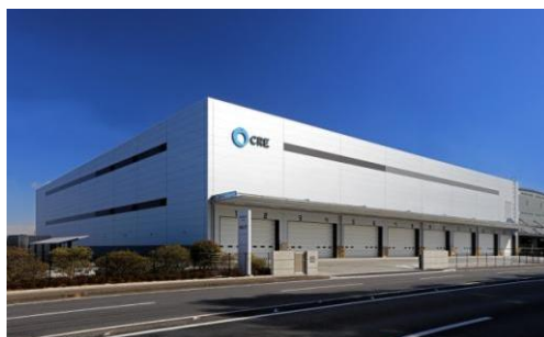
6 ロジスクエア久喜II 2017年2月竣工