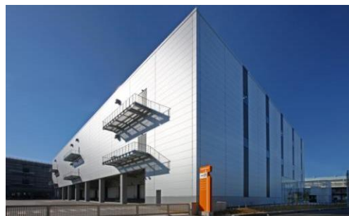
2 ロジスクエア八潮 2014年1月竣工