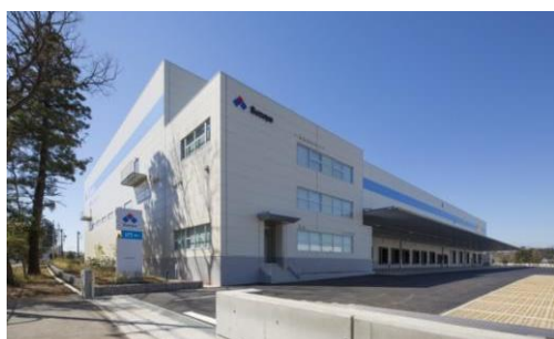
3 ロジスクエア日高 2015年3月竣工