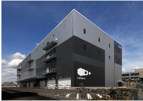
25 ロジスクエア松戸 2023年5月竣工