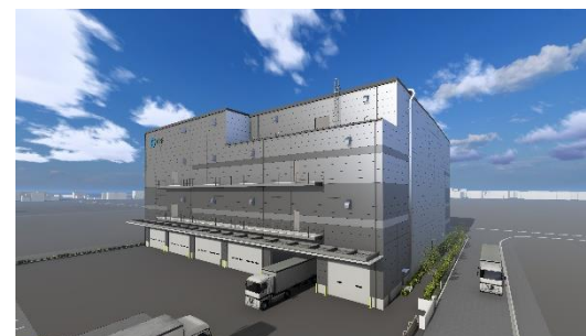
42 ログスクエア厚木南 2025 年 10 月末竣工予定