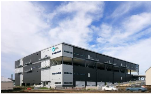
17 ロジスクエア三芳 2020年6月竣工