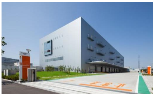
1 ロジスクエア草加 2013年6月竣工