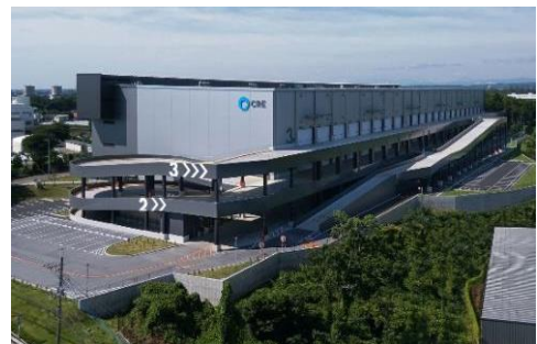
18 ロジスクエア狭山日高 2020年6月竣工