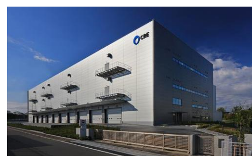
8 ロジスクエア新座 2017年4月竣工