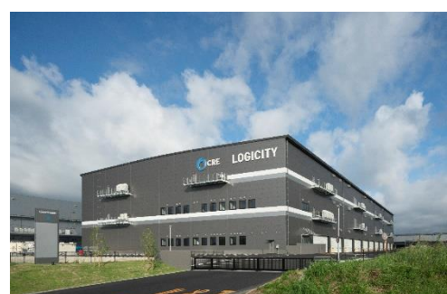
32 ロジシティ小郡 2024年7月竣工