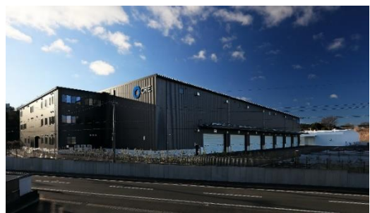
28 ロジスクエア掛川 2024年1月竣工