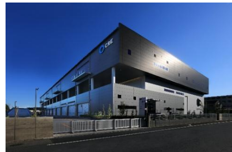
22 ロジスクエア白井 2022年12月竣工