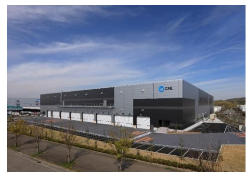
16 ロジスクエア神戸西 2020年4月竣工