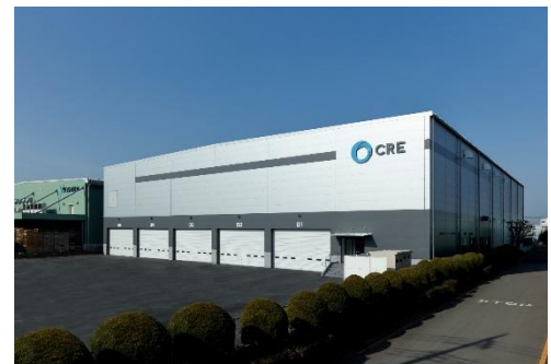
12 ロジスクエア川越 2018年2月竣工