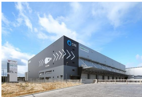
29 ロジスクエア福岡小郡 2024年2月竣工