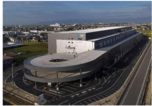
26 ロジスクエア一宮 2023年9月竣工