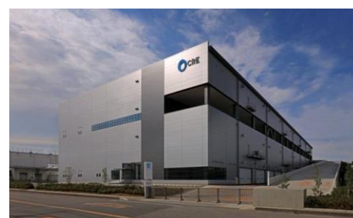
4 ロジスクエア久喜 2016年6月竣工