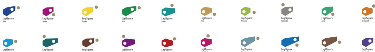
※建物のパース図をイメージした六角形の要素は各施設の面積に応じて長さが変動、階数に応じて高さが変動します。

「LogiSquare」は、小規模利用から高度なセキュリティ対策まで、100社100様のニーズに応え、さらに、誰でも直観的に理解できるユニバーサルデザイン等の普遍性、保管商品が変わっても使い続けることのできる汎用性も備えています。そういった「LogiSquare」の多様性を表すものとして、ベーシックロゴに加え、施設ごとに一定のルールで可変するダイナミックロゴも展開していきます。