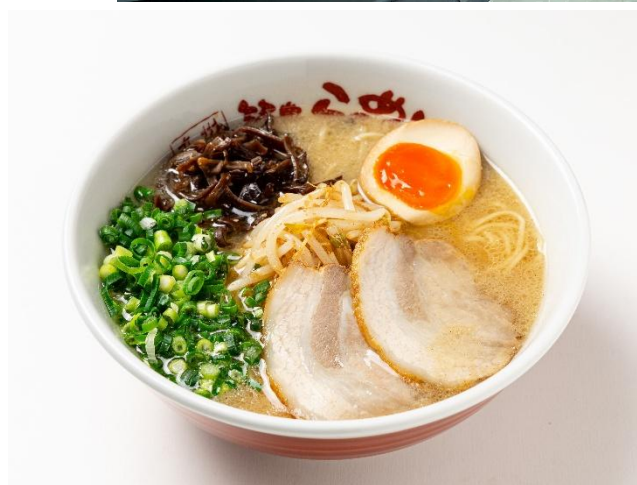
当店イチオシの「匠（たくみ）ラーメン」