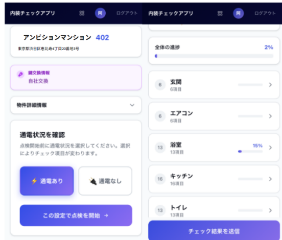
【現場担当者ウェブアプリ画面】