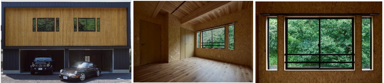
国産材 CLT を活用した環境配慮型ガレージ付賃貸住宅『Sustainable PGH』（写真は神奈川県小田原市の第 1 号物件）

「Sustainable PGH」は、愛車やバイクと共に心豊かに暮らすライフスタイルと環境配慮の両立を目指す「プレミアムガレージハウス」における新たな商品コンセプトです。構造材に国産材 CLT (*) を採用することで、建築時の CO 2 排出削減と炭素固定に貢献。ガレージハウスとしての高いデザイン性と、木質構造ならではの優れた断熱性・耐震性を兼ね備え、住む人と環境の双方に価値を提供します。